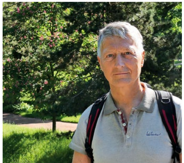
Gerd Börner (c) Meiningen GmbH

>> Geführte Wanderung „Breubergtour“ (Jahresabschlussstour), am Sonntag, 22. Oktober 2023 ab 10 Uhr, Strecke: ca. 13 km, Kosten: 7,00 EUR p. P. (Kinder bis 12 Jahre frei).