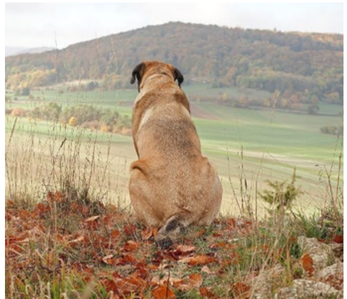
Wau ... Wow, was ist die Rhön so schön!