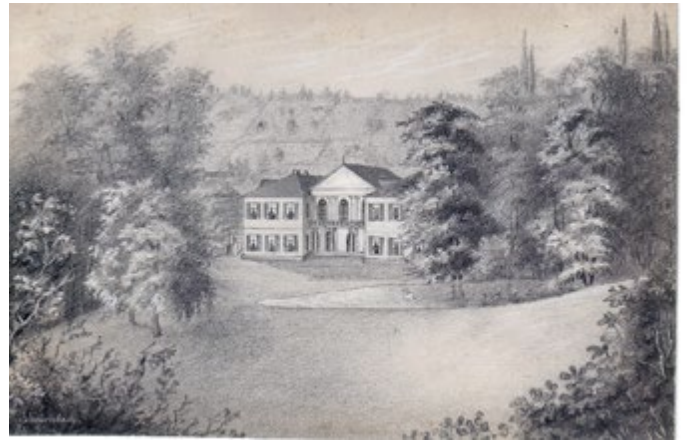
Der Wagen rollt, Baumbachzeichnung Englischer Garten: Englischer Garten. Originalzeichnung von Rudolf Baumbach 1857.