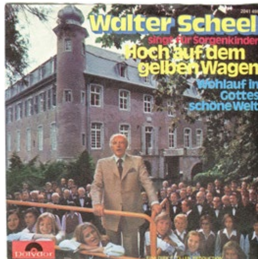
Der Wagen rollt, Singlecover1973: Singlecover „Hoch auf dem gelben Wagen“ 1973. CR: IDT Music Düsseldorf